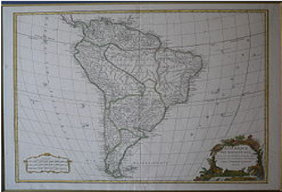
Mapa de América del Sur de 1750.

facultad a los Gobernadores de las provincias para que ellos o las personas que eligieren tengan como objeto la demarcación de la línea entre las dos coronas.